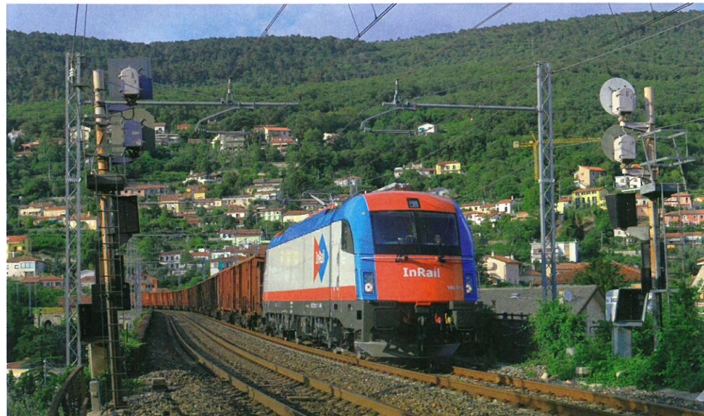
E 190 311 di InRail alla trazione di un merci

Paolo Recagno (Gruppo Fermodellistico Milanese)